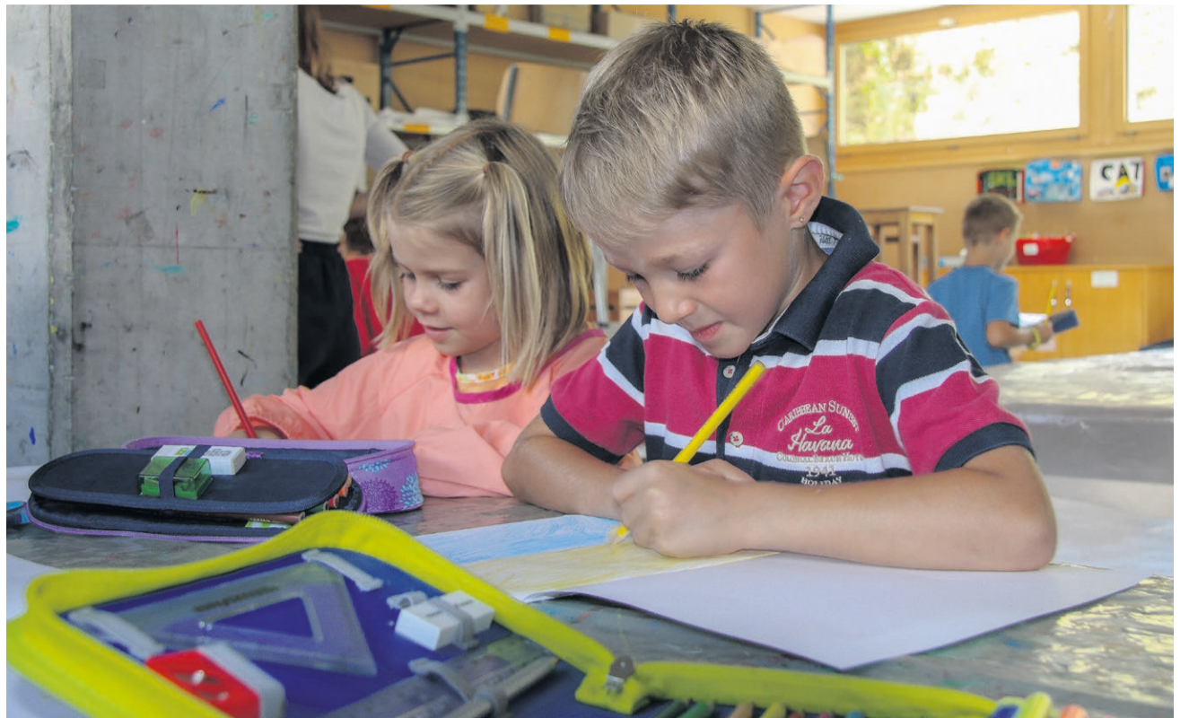
Sowohl die Primarschulen Pfaffnau (hier ein Bild vom ersten Schultag) und St. Urban als auch die Sekundarschule Pfaffnau erhielten bei der externen Evaluation gute Noten.

Ebenfalls ins Auge gefasst wurde bei der Evaluation die Situation an der Sekundarschule Pfaffnau. Dort herrscht ein friedliches Klima, welches durch verschiedene gemeinsame Aktivitäten gefördert wird. Die Lernenden können sich via Schülerrat einbringen. Das Elterngremium engagiert sich vielfältig und organisiert regelmässig Anlässe für Eltern. Das kleine Lehrerteam setzt